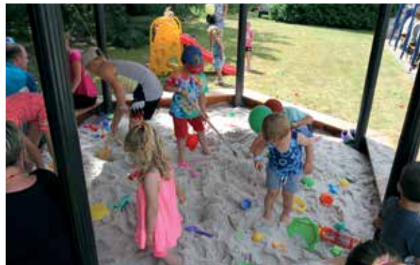
24. 6. 2017 Zaměstnanecký den konaný v areálu společnosti Sklopísek Střeleč a. s.